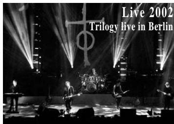
Live 2002 Trilogy live in Berlin