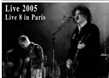
Live 2005 Live 8 in Paris

The Cure (ザ・キュアー): 1978年にデビューしたイギリスのロックバンド。現在のメンバーは、ロバート・スミス(ボーカル、ギター)、サイモン・ギャラップ(ベース)、ポール・トンブソン(ギター、キーボード)、ジェイソン・クーバー(ドラム)。26年余にわたる活動中、オリジナルアルバム12枚、コンピレーションアルバム7枚、ライブアルバム4枚、ライブビデオ5本を含む10本のビデオをリリースしている。1989年MTVヨーロッパでベストビデオ受賞(「ララバイ」、同年シングル「ラブソング」が米ビルボードのシングルチャートで2位、1991年にブリッツアワードのベスト・ブリティッシュグループ賞を受賞。1992年アルバム「ウィッシュ」が英アルバムチャート1位(米ビルボード2位)、2000年アルバム「ブラッドフラワーズ」がグラミー賞にノミネート。近況では、2004年に、12作めにしてセルフタイトルを冠したアルバム「The Cure」をリリースし、オリジナルアルバムのデジタルリマスターリング盤を、レア音源を収録したボーナスCD付きで、順次リリースをスタート。また、2005年には、9年ぶりのメンバーチェンジがあり、ペリー(ギター)とロジャー(キーボード)が抜け、ポール・トンブソン(ギター・キーボード)が再加入。この秋にも、13作目のアルバムのレコーディングを開始予定。ライブの質の高さには定評があり、世界中で1000以上のライブを行い、アリーナクラスはもちろんのこと、ローズボールなどのスタジアムクラスのオーディエンスも熱狂させている。2002年秋には、アルバム「ポルノグラフィター」、「ディスインテグレーション」、「ブラッドフラワーズ」の収録曲を全てアルバムどおりの順に演奏する「トリロジーコンサート」を行ったが、4時間近い熱演で、オーディエンスを驚嘆させた。このライブのDVDは、日本でもリリースされ、完成度の高いステージを垣間見ることがができる。2004年には、アメリカでThe Cureを信奉するバンド Interpol、The Rapture、Mogwai等と Curiosa Festivalと題されたフェスティバル形式のツアーを敢行。また、2005年7月には、アフリカ支援のための世界規模のコンサート・イベント「ライブ8」に参加し、パリの会場にて、25分余、全5曲の真摯な演奏を行なった。グラストンベリーで2度もトリを務めるなど、フェスティバルの参加も多く、2005年夏にもヨーロッパで、フェスティバル・ツアーが行われた。フロントマンのスミスは、個性的なボーカルで知られるが、またギタリストとしても世界的に認められており、米ギター専門誌の表紙を飾るなどギターワークの面でも評価は高い。日本には1984年に初来日し、大阪、東京で計3回のライブを行っているが、その後は、1987年にプロモーションで来日したのみ。もし2006年に実現すれば、実に22年ぶりになる再来日公演は、日本のファンにとって悲願・・・。